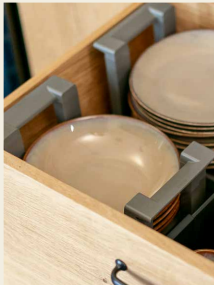
Bordenhouder Aanpasbaar voor stabiel opbergen en verplaatsen van borden