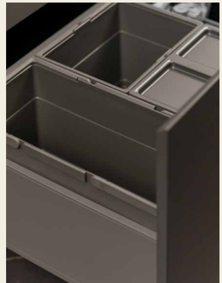
Afvalemmer Te verkrijgen in 14 of 21 liter, met deksel