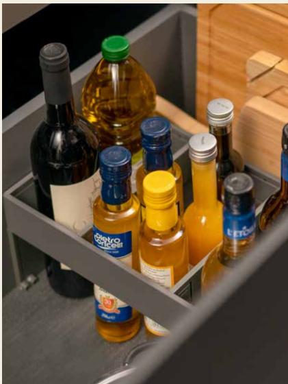
Flessenhouder Zorgt voor het stabiel opbergen van flessen