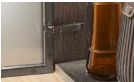
Application cadre alu 95° CLIP top