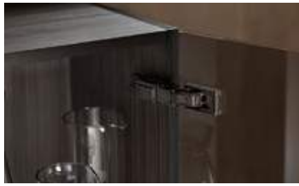
Application pour portes en verre ou miroir CLIP top BLUMOTION CRISTALLO