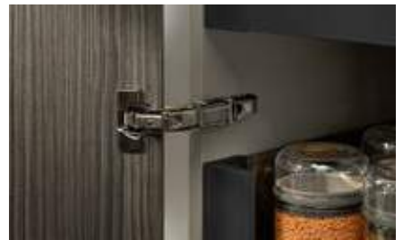
Application grand angle 155° CLIP top BLUMOTION