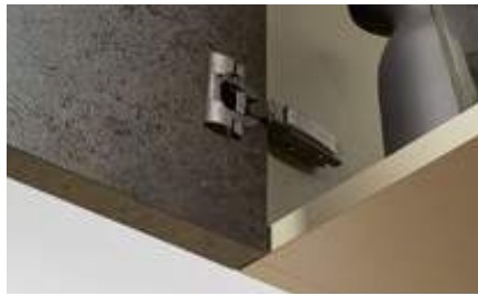
Application porte épaisse 95°, 125° CLIP top BLUMOTION, encombrement 0