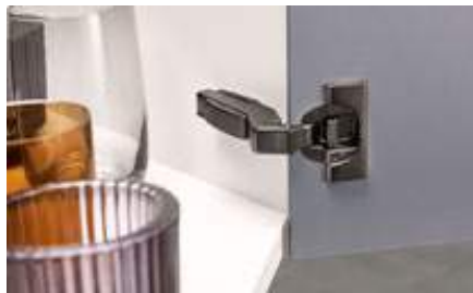
Application d'angle +15° III, +30° II, +45° I, +45° II CLIP top BLUMOTION