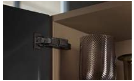
Application pour portes minces CLIP top BLUMOTION