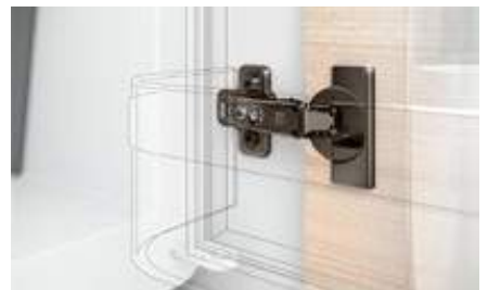
Application pour réfrigérateur MODUL