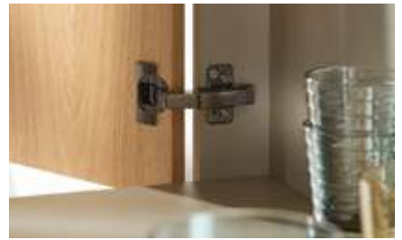
Portes dans le prolongement CLIP top BLUMOTION