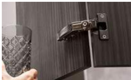
Application pour meuble d'angle CLIP top