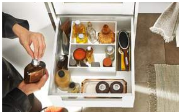
Kosmetikartikel im Bad sind ansprechend geordnet und sofort zur Hand, hier mit LEGRABOX pure in der Farbvariante Seidenweiß matt.