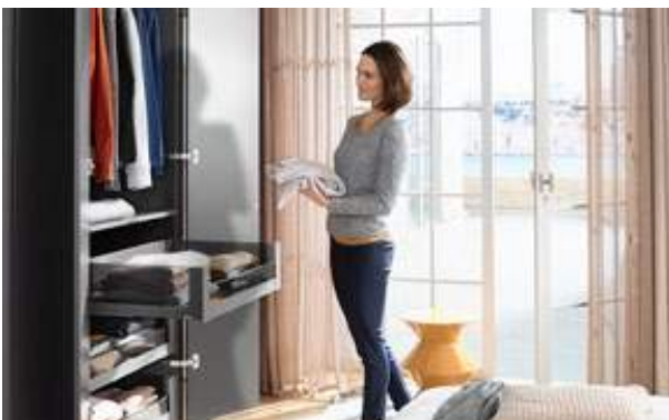
Der große Stauraum und der komfortable Zugriff machen SPACE TOWER zu einer optimalen Lösung im Schlafzimmer.